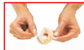
Retirez les protecteurs de pastique.