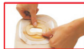
Modelez l'anneau pour un meilleur confort.