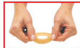
Étirez l'anneau ou empilez-les pour un meilleur ajustement.