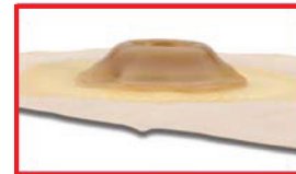
Créez une convexité plus importante ou plus flexible.