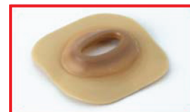
Créez une convexité ovale.