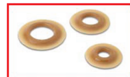
Anneaux de champ protecteur Adapt – convexes code de produit 795xx

*La peau irritée, au pourtour de la stomie, devrait être évaluée par un professionnel de la santé qualifié. Ce dernier pourra déterminer la cause de l'irritation et vous aider à trouver une solution.